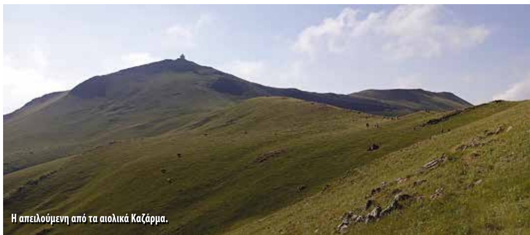
Η απειλούμενη από τα αιολικά Καζάρμα.

Η VIA AGRAFA δεν ήταν απλώς μια διάσχιση. Ήταν μια κατάδυση στην καρδιά των Αγράφων – ενός τόπου σκληρού και πανέμορφου, που δεν εντυπωσιάζει φωναχτά, αλλά σε κερδίζει βαθιά. Τα Αγραφα δεν είναι προορισμός. Είναι εμπειρία. Απαιτούν σεβασμό, προετοιμασία και ανοιχτή διάθεση. Σε αντάλλαγμα προσφέρουν κάτι σπάνιο: την αίσθηση ότι περπατάς σε έναν τόπο αυθεντικό, ανεξίτηλο, βαθιά ελεύθερο.