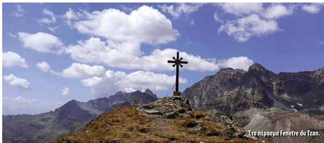
Στο πέρασμα Fenetre du Tzan.

12 Αυγούστου. Αναχώρηση πρωί με ελαφρά κατηφορική πορεία και στη συνέχεια ανάβαση μέχρι το διάσελο Col Chalebby (2653μ.) σε 1 ώρα, στη συνέχεια μικρή κατάβαση και ανάβαση μέχρι το επόμενο διάσελο Col de Vessonaz (2793μ.), πάλι σε 1 ώρα. Μετά πήραμε τον κατήφορο σε μια ωραία κοιλάδα που είχε πληγεί από χιονοστοιβάδα. Ακολουθώντας το μονοπάτι μέσα στο δάσος και μια νέα παράκαμψη λόγω της καταστροφής του μονοπατιού φτάσαμε χαμηλά κι αφήσαμε τη διαδρομή για ένα μονοπάτι στα δεξιά που διέσχιζε με μια μικρή γέφυρα το στένωμα του φαραγγιού. Στη συνέχεια ανηφορικά μέσα στη μεσημεριανή ζέστη βγήκαμε στον οικισμό Close μετά από 5,5 συνολικά ώρες και πήραμε το λεωφορείο για Bionnaz για να καταλύσουμε στο ξενώνα La Batische. Μείναμε σε 2 ωραία τετράκλινα δωμάτια, απο-