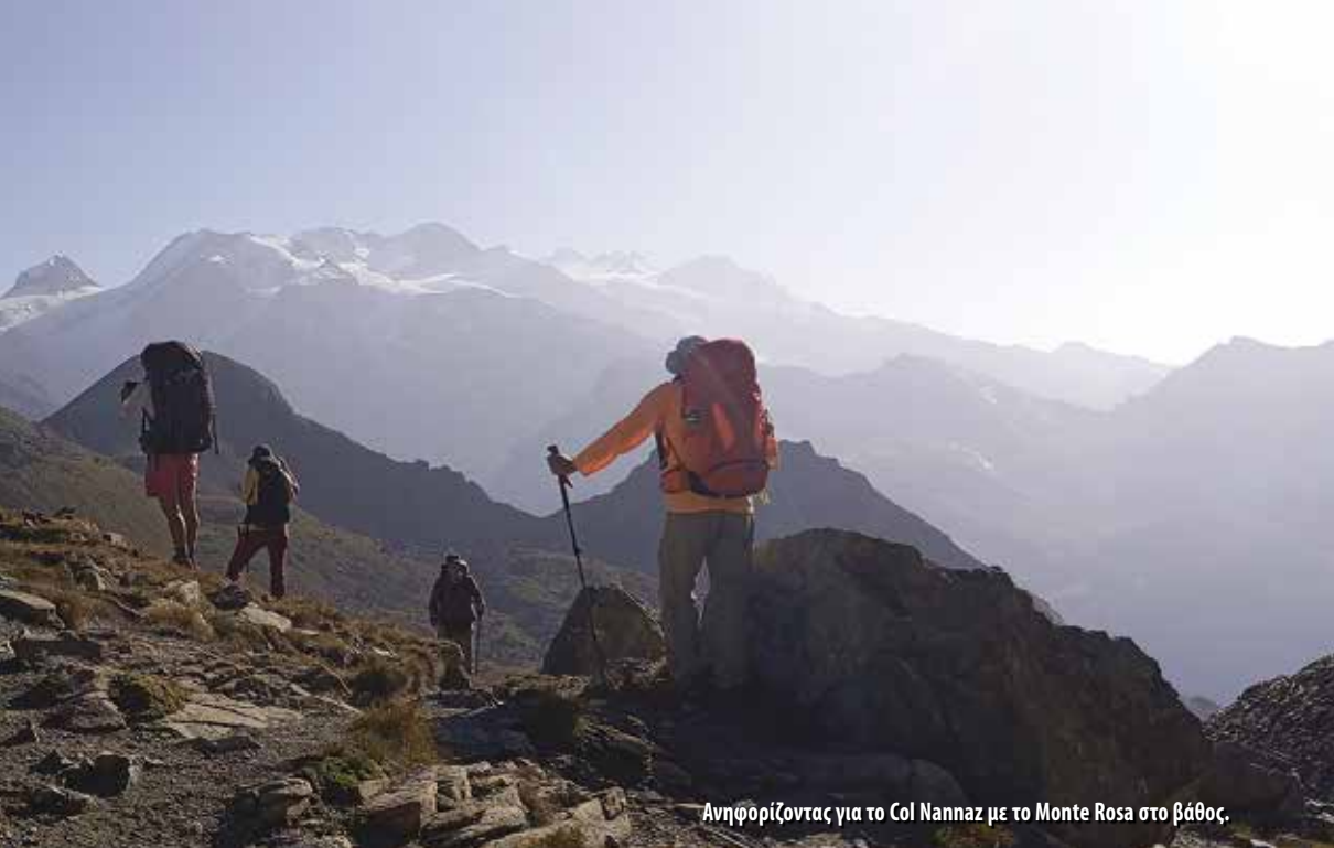
Ανηφορίζοντας για το Col Nannaz με το Monte Rosa στο βάθος.

Μείναμε όλοι μαζί σ' ένα δωμάτιο, μπάνιο με κέρμα κι επιτέλους ένα τυπικό ορειβατικό δείπνο καταφυγίου.