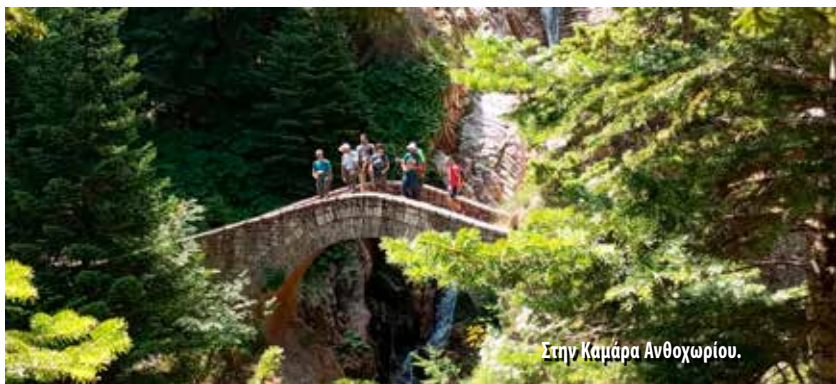
Στην Καμάρα Ανθοχωρίου.