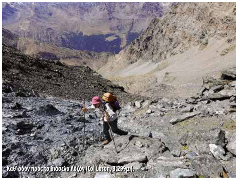
Καθ' οδόν προς το διάσελο Λοζόν (Col Loson, 3.299μ.).