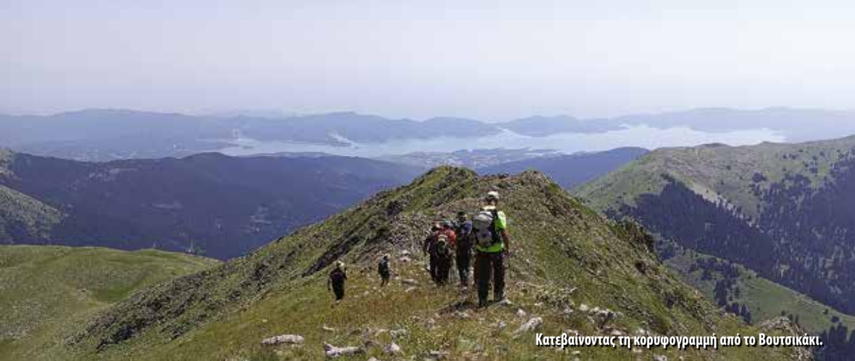
Κατεβαίνοντας τη κορυφογραμμή από το Βουτσικάκι.