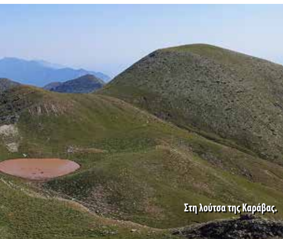
Στη λούτσα της Καράβας.