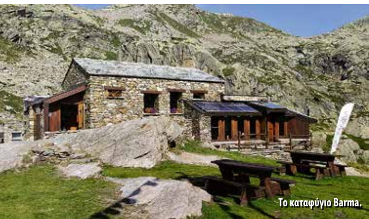
Το καταφύγιο Varma.