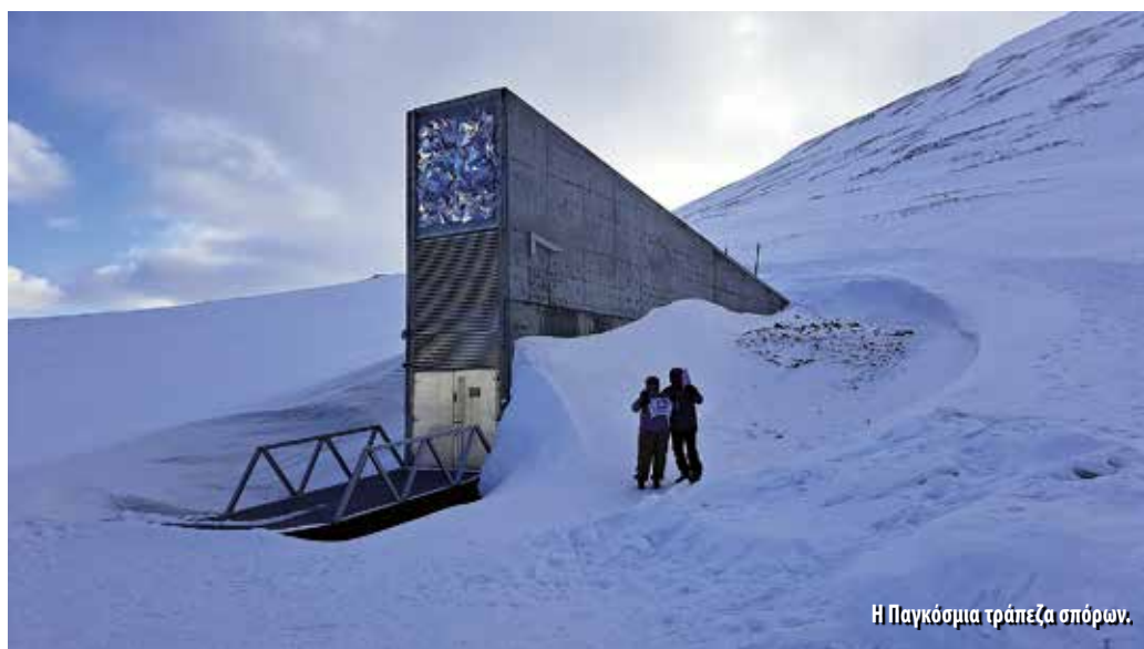
Η Παγκόσμια τράπεζα σπόρων.

Μ' αυτά και με τ' άλλα φτάσαμε στο σημείο εκκίνησης. Μεσάνυχτα στο Ε. Βενιζέλος, κάτι σε φιλμ νουάρ, ευτυχώς λίγοι ταξιδιώτες ξαπλωμένοι καταγής, εμείς προχωρήσαμε στα γκισέ της Air France, η οποία έχει την πρώτη πρωινή πτήση καθημερινά στις 03:20. Ζύγισμα των σάκων explorer με... καλά αποτελέσματα και πτήση για Tromso (Τρόμσου προφέρεται από τούς ντόπιους) μέσω Παρισίων. Αφιξη 06:30 στο