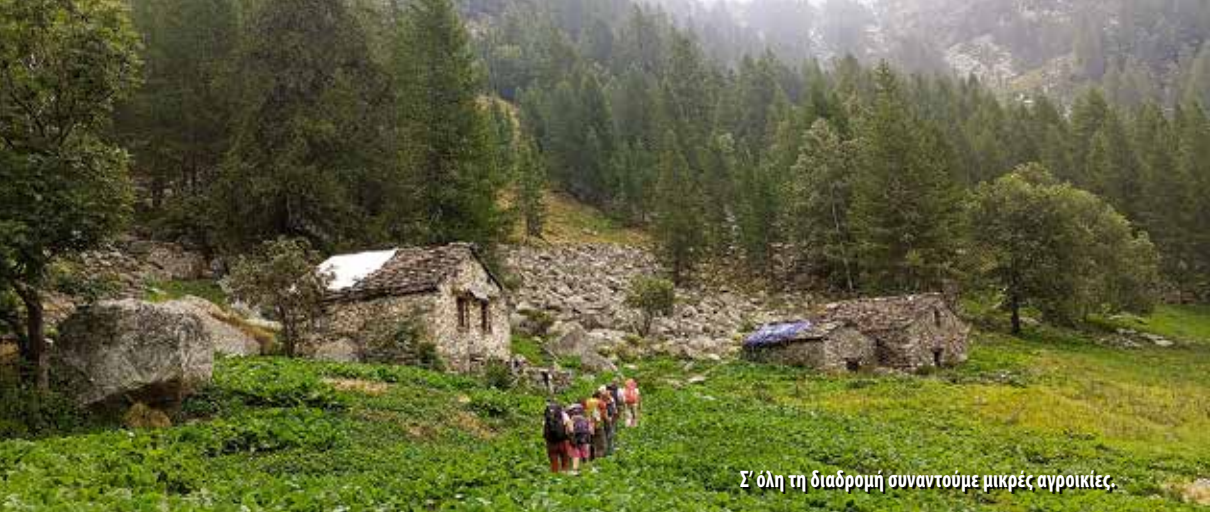
Σ' όλη τη διαδρομή συναντούμε μικρές αγροικίες.