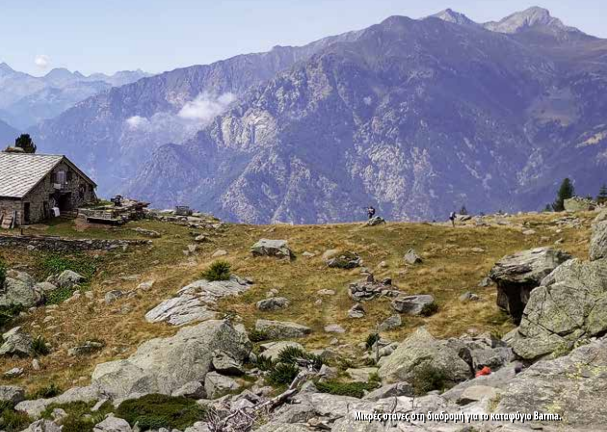
Μικρές στανές στη διαδρομή για το καταφύγιο Barma.

3 Αυγούστου. Επειδή η διαμονή μας ήταν στο Pont Saint Martin, είπαμε να μην αρχίσουμε την εξόρμηση από το γειτονικό Donnas, αλλά από εκεί. Γεμάτοι ενθουσιασμό ξεκινήσαμε πρωί