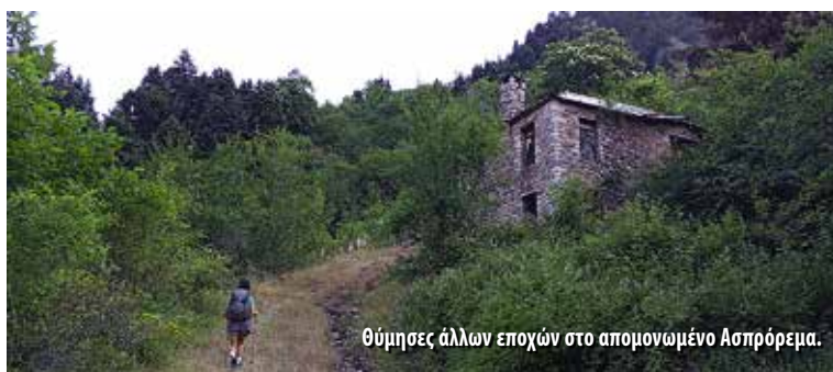
Θύμησες άλλων εποχών στο απομονωμένο Ασπρόρεμα.