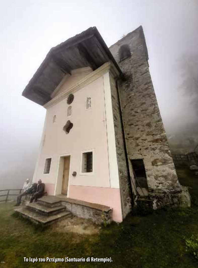
Το Ιερό του Ρετέμπιο (Santuario di Retempio).