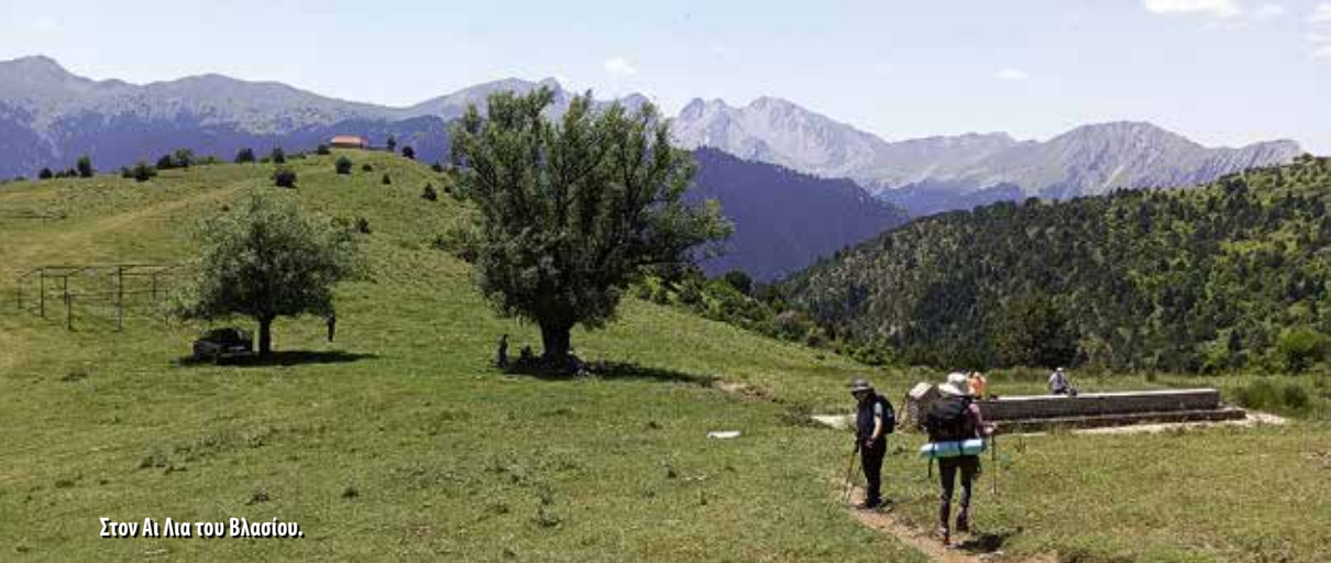
Στον Αι Λια του Βλασίου.