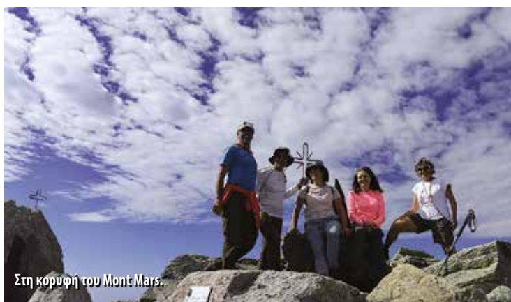
Στη κορυφή του Mont Mars.

του δρόμου. Ακολουθώντας τον δρόμο μέχρι την επόμενη αγροικία (με νερό), πιάσαμε πάλι ανηφορικό μονοπάτι μέσα σε δάσος, που μας έβγαλε σε εγκαταλειμμένη στάση με νερό δίπλα σε δρόμο. Μετά από μια μεγάλη στάση ακολουθήσαμε για λίγο τον δρόμο και τον αφήσαμε ακολουθώντας τη διαδρομή στα δεξιά. Σε λίγα λεπτά φτάσαμε