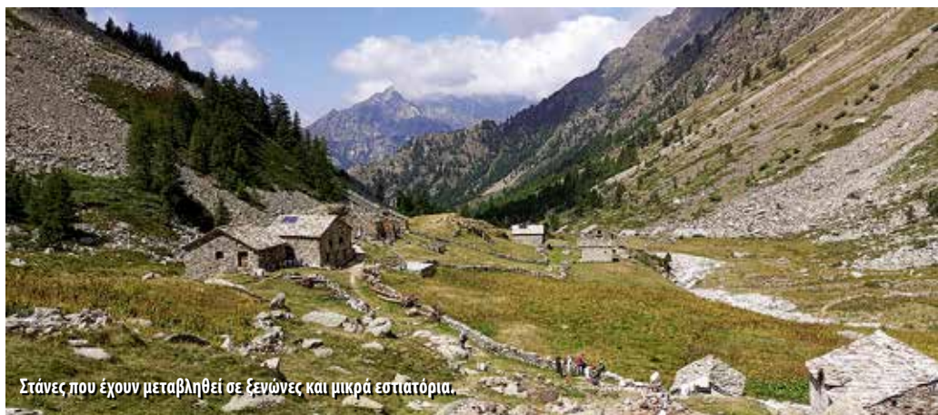
Στάνες που έχουν μεταβληθεί σε ξενώνες και μικρά εστιατόρια.

τη φιγούρα μιας κοπέλας και τα ονόματα μάλλον των εργατών. Στη συνέχεια κατάβαση σε στριφογυριστό μονοπάτι μέχρι να περάσουμε στεγνή ρεματιά με σκάλα σε βράχο, για να ακολουθήσει 30λεπτη ανάβαση σε δάσος, στη συνέχεια κατάβαση και τραβέρσα σε πλαγιά, για να περάσουμε δύο ρέματα με γέφυρες, πριν καταλήξουμε στον οικισμό Niel και τον ονειρικό ξενώνα La Gruba μετά από 9,5 συνολικά ώρες. Διαμονή σε υπέροχα δωμάτια και, φυσικά, ένα ακόμη γκουρμέ δείπνο με τοπικές λιχουδιές.