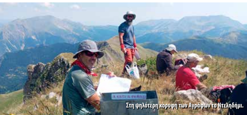
Στη ψηλότερη κορυφή των Αγράφων το Ντεληδήμι.

με ψητά, ποτά και καλή παρέα, για να μας πει πως η μάνα του τον γέννησε εκεί στο Ασπρόρεμα και πως τη διαδρομή που εμείς χρειαστήκαμε 5 ώρες συνολικά (υψομετρική διαφορά +/-300μ.) την έκαναν μικρά παιδιά μόνα τους με τα αδέρφια του για να πηγαίνουν στο σχολείο στα Επινιανά. Το βουνό γίνεται σπίτι.