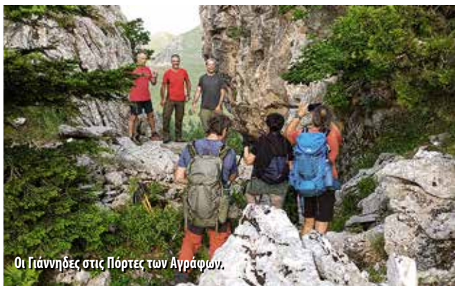
Οι Γιάννηδες στις Πόρτες των Αγραφών.