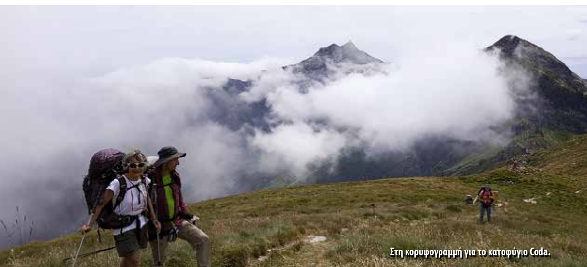
Στη κορυφογραμμή για το καταφύγιο Coda.

του δρόμου. Ακολουθώντας τον δρόμο μέχρι την επόμενη αγροικία (με νερό), πιάσαμε πάλι ανηφορικό μονοπάτι μέσα σε δάσος, που μας έβγαλε σε εγκαταλειμμένη στάση με νερό δίπλα σε δρόμο. Μετά από μια μεγάλη στάση ακολουθήσαμε για λίγο τον δρόμο και τον αφήσαμε ακολουθώντας τη διαδρομή στα δεξιά. Σε λίγα λεπτά φτάσαμε