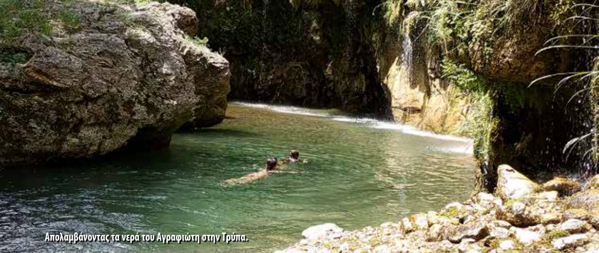
Απολαμβάνοντας τα νερά του Αγραφιώτη στην Τρύπα.