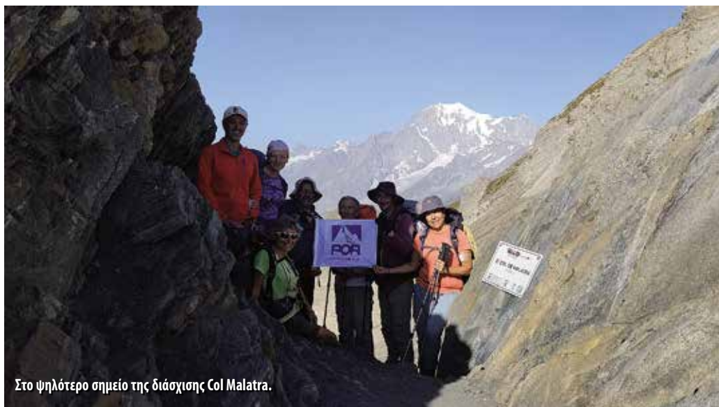
Στο ψηλότερο σημείο της διάσχισης Col Malatra.

14 Αυγούστου. Αναχώρηση αρκετά πρωί ανηφορικά μέχρι το διάσελο Col Champillon (2709μ.) σε λιγότερο από 1 ώρα. Από εκεί κατηφορικά μέχρι τη γέφυρα του χειμάρρου Menoune στα 1620μ., όπου κάναμε μια μεγάλη στάση. Στη συνέχεια, λίγο από δρόμο κι έπειτα από μονοπάτι, βγήκαμε σε δρόμο μέχρι τον οικισμό Eternon Dessous, απ' όπου πιάσαμε το μονοπάτι που μας έβγαλε σε δρόμο ψηλότερα, που τον ακολουθήσαμε μέχρι το χωριό Saint Rhemy (1620μ.), όπου φτάσαμε σε 5,5 συνολικά ώρες. Εκεί κάναμε 1