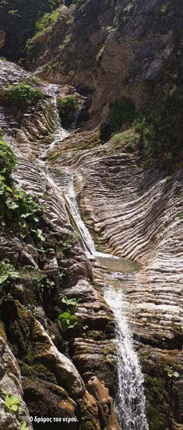
Ο δρόμος του νερού.

ώρες πορείας με 800μ. θετική υψομετρική και 150μ. αρνητική σφράγισε την είσοδό μας στον κόσμο των Αγράφων.