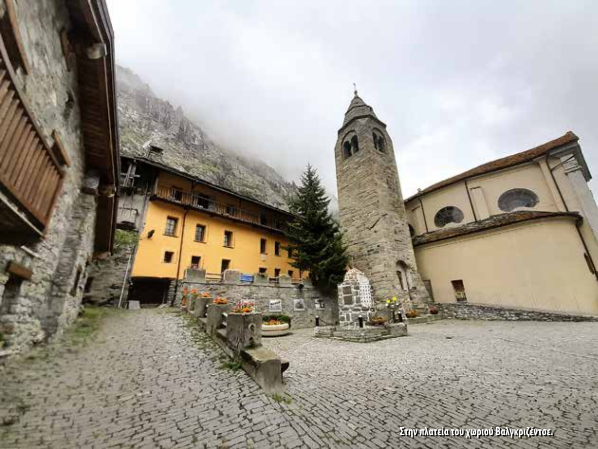
Στην πλατεία του χωριού Βαλγκριζέντσε.

πλατείες ξεχωρίζουν τα ανθισμένα παρτέρια και οι παραδοσιακές πέτρινες βρύσες, απ' όπου αναβλύζει κρυστάλλινο νερό των Άλπων. Συχνά, το νερό της βρύσης τρέχει σε κούφιους κορμούς δέντρων, προσεκτικά σκαλισμένους ώστε να λειτουργούν ως γούρνες: οι ντόπιοι τις αποκαλούν abbeveratoi , ποτίστρες. Τίποτα δεν διαταράσσει αυτή την αρμονική εικόνα, ούτε κακοτεχνίες ούτε σκουπίδια. Στην Κοιλιάδα υπάρχουν επίσης πολυάριθμα μεσαιωνικά κάστρα και οχυρωμένα αρχοντικά, που ενισχύουν ακόμη περισσότερο τον ατμοσφαιρικό χαρακτήρα του τόπου.