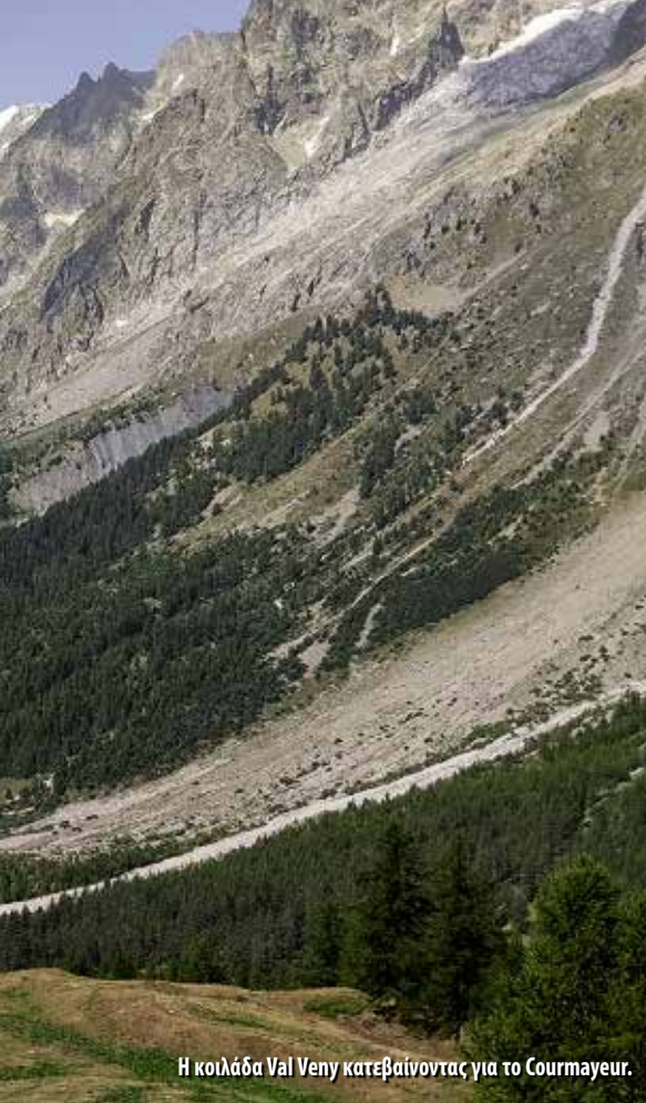
Η κοιλάδα Val Veny κατεβαίνοντας για το Courmayeur.

με άλλους, αφού το καταφύγιο ήταν υπερπλήρες κυρίως από μικρά παιδιά. Ένα σημαντικό στοιχείο είναι ότι το καταφύγιο έχει χτιστεί με εργασία εκατοντάδων εθελοντών που ανήκουν στην οργάνωση Mato Grosso, δημιούργημα του Ugo de Censi, που αφιέρωσε τη ζωή του στη βελτίωση