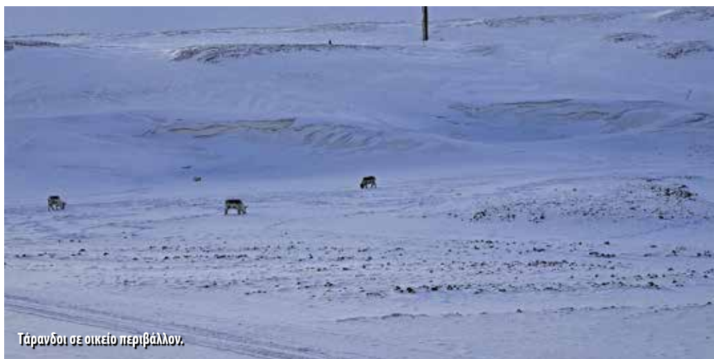
Τάρανδοι σε οικείο περιβάλλον.

Η πρώτη στάση μας έγινε σε έναν μικρό μώλο, λιμανάκι θα έλεγα, όπου ξεπρόβαλαν μερικές φώκιες που έπαιζαν βουτώντας και ξαναεμφανιζόμενες στη επιφάνεια, μάλλον εξασφάλιζαν