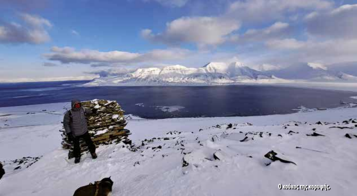
Ο κούκος της κορυφής.

Για την ιστορία, το ταξίδι μας στη Νορβηγία ήταν για τρίτη φορά, μετά τις προηγούμενες επισκέψεις μας στο Bodo (ατομικά) αλλά και με οργανωμένο γκρουπ, πράγμα που μας βοήθησε να κατανοήσουμε καλύτερα τις απαιτήσεις ενός τέτοιου ταξιδιού. Αξίζει να αναφερθεί ότι και οι