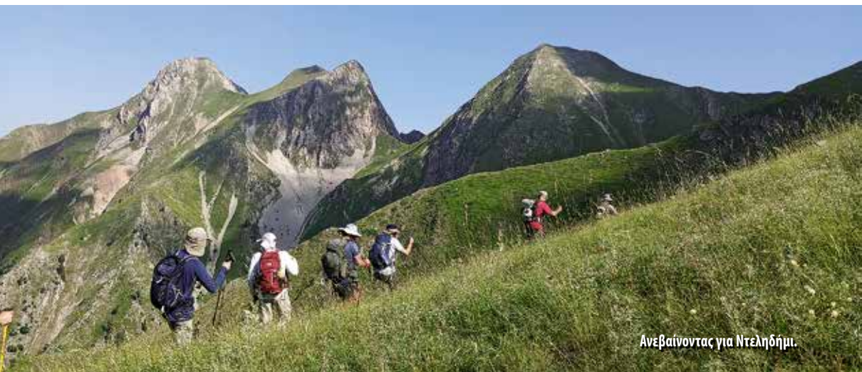
Ανεβαίνοντας για Ντεληδήμι.

Απότομες ανηφόρες, τραβέρες και διάσελα, πηγές που στάζουν λίγο. Στην κορυφή (Ντελιδίμι, 2163μ.) βρεθήκαμε με ελαφριά σακίδια, αλλά με