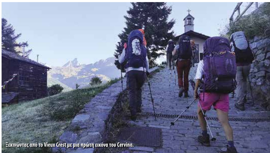
Ξεκινώντας από το Vieux Crest με μια πρώτη εικόνα του Cervino.

την εμφάνιση του και στη συνέχεια κατάβαση σε ανοιχτά λιβάδια, περνώντας από τη στάνη-μπαρ Blekene, λίγο παρακάτω από το εκκλησάκι του San Lorenzo, για να μπούμε στη συνέχεια σε καλό μονοπάτι μέσα στο φαράγγι του χειμάρου Loo που μας έβγαλε σε 2,5 ώρες από το διάσελο στον οικισμό Steina, στον δημόσιο δρόμο της κοιλάδας