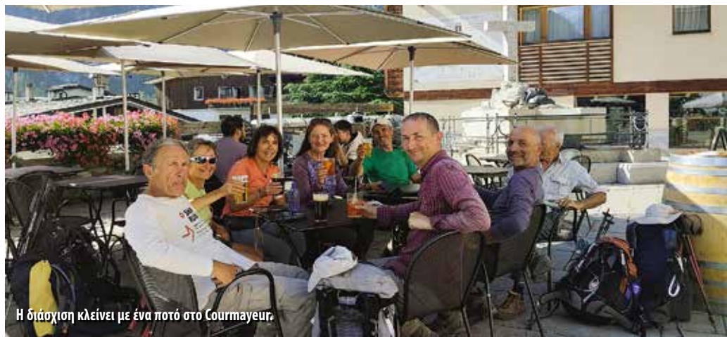
Η διάσχιση κλείνει με ένα ποτό στο Courmayeur.