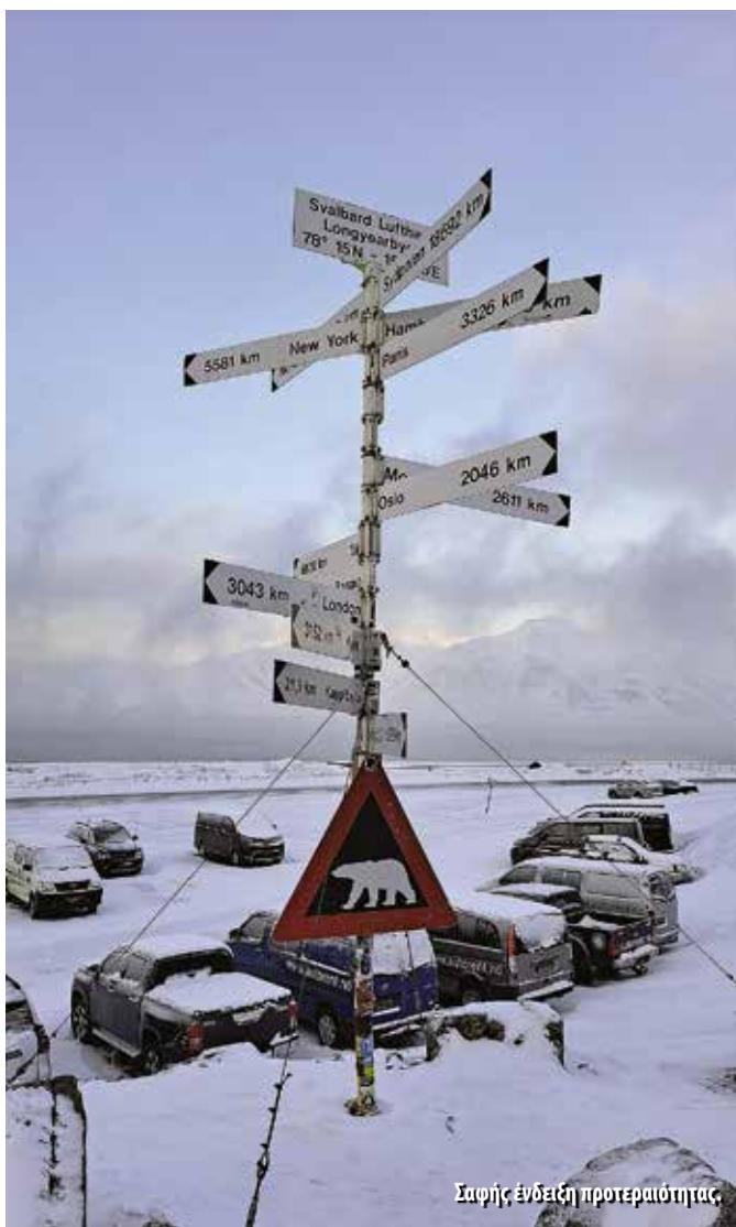
Σαφής ένδειξη προτεραιότητας.

πλισμένα και οι πιλότοι διαθέτουν ειδικές άδειες για την προσγείωση στον μικρό παγωμένο διάδρομο του νησιού. Μαζί μας ταξίδευαν επιστήμονες, φοιτητές και λοιποί ερευνητές για τον επιστημονικό σταθμό του Ny-Ålesund. Πτήση φραπέ, αν είχε φωνή το αεροπλάνο μας να έλεγε τι πέρασε στον αεροκαρόδρομο που μας έβγαλε τα σκώτια μέχρι τη θεαματική προσγείωσή μας και τη χιονοθύελλα που προκάλεσε το αεροπλάνο πατώντας στον πάγο, λέγε διάδρομο!! Βγήκαμε σε μια ανέλπιστα λιακάδα και μια κρύα ατμόσφαιρα που απλά σε έσφαζε και τρυπούσε τα πάντα!!! Έξω από τον αεροσταθμό η απαγορευτική πινακίδα ότι δεν επιτρέπεται η ατομική μετακίνηση λόγω αρκούδων, εμείς και όλοι οι υπόλοιποι με τις αποσκευές μας επιβιβαστήκαμε στο λεωφορείο, το οποίο δεν ξεκινάει πριν φορτωθεί και η τελευταία βαλίτσα από τον διάδρομο που τις μεταφέρει και μετά κλείνει το ίδιο το μικρό αεροδρόμιο και κάθε επιβάτης κατευθύνεται στον προορισμό του είτε με το λεωφορείο, είτε με ταξί είτε με ΙΧ είτε με snowmobile με βαριά οπλισμένο συνοδό. Όλα τα υπόλοιπα περί πεζοπορίας απλά απαγορεύονται. Η μοναδική