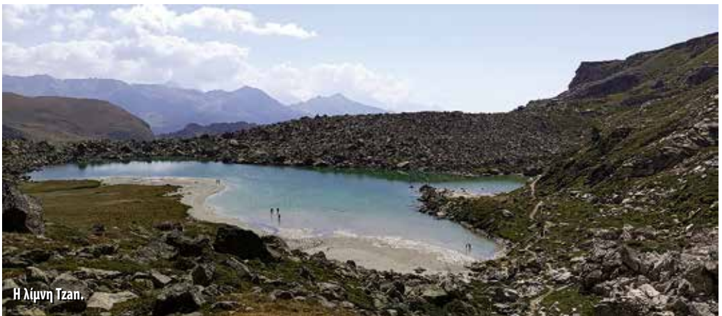
Η λίμνη Tzan.

11 Αυγούστου. Ξεκινήσαμε τη συνηθισμένη πρωινή ώρα και αυτή τη φορά κατηφορικά μέχρι