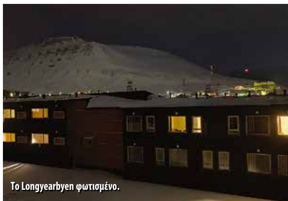
Το Longyearbyen φωτισμένο.

την στιγμή. Μας απάντησε ένας ευγενής κύριος που μιλούσε καλά ελληνικά και προσφέρθηκε να μας εξυπηρετήσει, δεδομένου ότι το Spitsbergen Svalbard είναι μεν νορβηγικό έδαφος, όμως αποτελεί αυτόνομη περιοχή με κυβέρνηση και πρωθυπουργό. Απαιτούνται ειδικές άδειες για να κυκλοφορήσει κάποιος αποκλειστικά με ένοπλο συνοδό (λόγω του κινδύνου επίθεσης από τις αρκούδες), άρα ξεχνάμε οτιδήποτε έχει σχέση με ατομική δραστηριότητα από την πύλη του αεροδρομίου και πέρα (υπάρχει και η σχετική προειδοποίηση που το αναφέρει με σαφήνεια). Ο κύριος της πρεσβείας μάς ρώτησε με ειλικρίνεια εάν ξέρουμε πού ακριβώς πηγαίνουμε, απαντήσαμε καταφατικά, η δεύτερη ερώτησή του ήταν για το αν θα επισκεφθούμε το Svalbard τους καλοκαιρινούς μήνες. Όταν ενημερώσαμε ότι σκοπεύουμε να πάμε στα μέσα Μαρτίου, μεσολάβησαν κάποια δευτερόλεπτα σιωπής από την διπλωματική πλευρά, μάλλον δεν πίστευε αυτά που άκουγε, διότι η