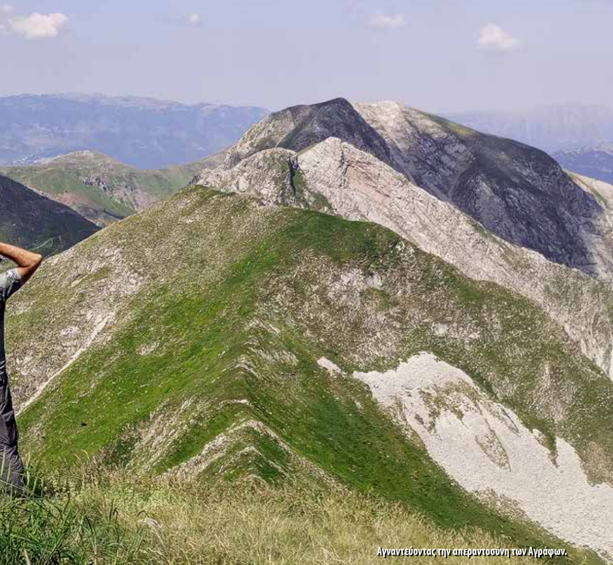
Αγναντεύοντας την απεραιτούση των Αγράφων.