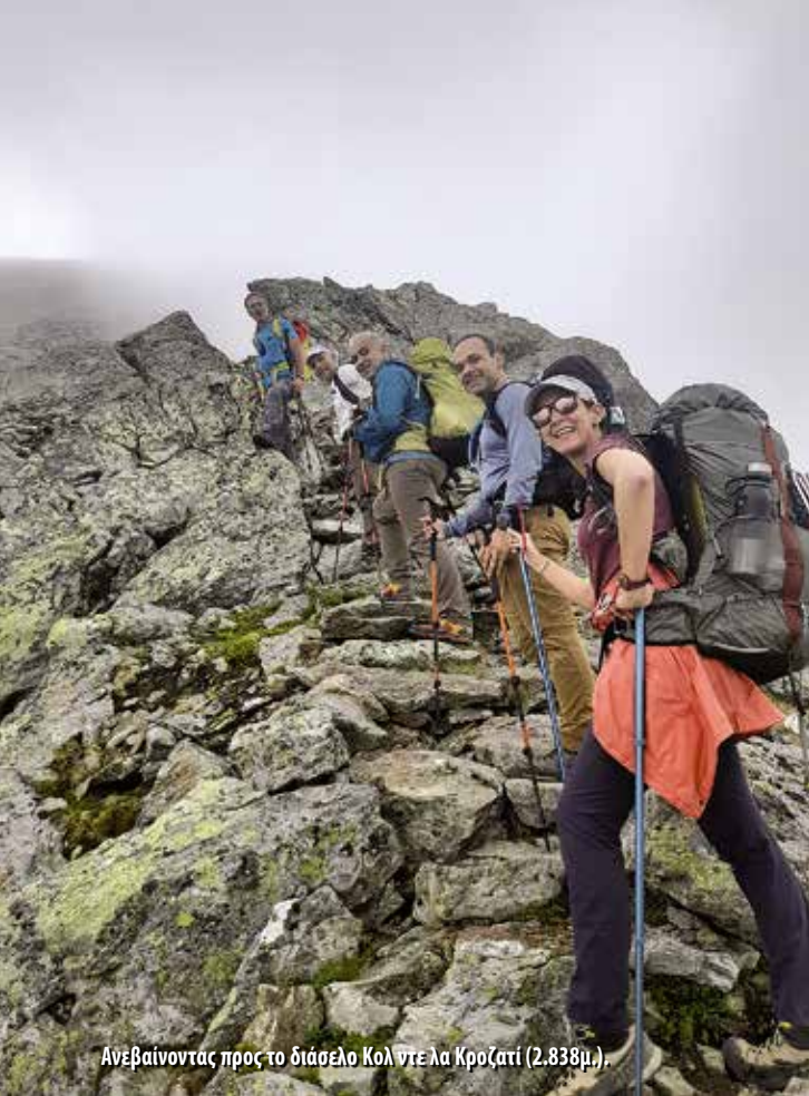
Ανεβαίνοντας προς το διάσελο Κολ ντε λα Κροζατί (2.838μ.).

Chavannes, «Διάσελο των Στανών/Καλυβιών», 2.592μ.). Από εκεί ακολουθήσαμε συνεχή κατηφορική πορεία που μας οδήγησε στη γραφική πολιχνη Λα Τυίλ (La Thuile, 1.435μ.) (tuile = κεραμίδι, πλάκα σχιστόλιθου), η οποία αριθμεί περίπου 790 κατοίκους. Η περιοχή γνώρισε άνθηση χάρη στην εξόρυξη ανθρακίτη, που είχε σημαντικό ρόλο έως και τον Β΄ Παγκόσμιο Πόλεμο. Ακόμη και σήμερα, γύρω από το χωριό σώζονται πολλά ορυχεία και παλιές μεταλλευτικές εγκαταστάσεις, αλλά η Λα Τυίλ έχει μετατραπεί πλέον σε δημοφιλές τουριστικό θέρετρο.