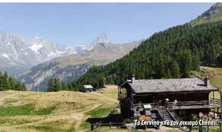
Το Cervino από τον οικισμό Chênèil.