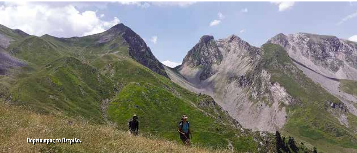
Πορεία προς το Πετρίλο.

διαδρομή, καταλαβαίνεις το μέγεθος του ταξιδιού. Η κατάβαση προς τις 9 Βρύσες, η επιστροφή στην Καμάρα και το γνώριμο μονοπάτι προς το Ανθοχώρι έκλεισαν τον κύκλο μετά από 7 ώρες πορείας με +900μ./-1300μ. Στην πλατεία, λίγο μετά τις 14:00, τα σακίδια κατέβηκαν για τελευταία φορά. Αγκαλιές, υποσχέσεις και η σιωπηλή βεβαιότητα πως τα Άγραφα δεν τελειώνουν εδώ — απλώς περιμένουν την επόμενη επιστροφή.