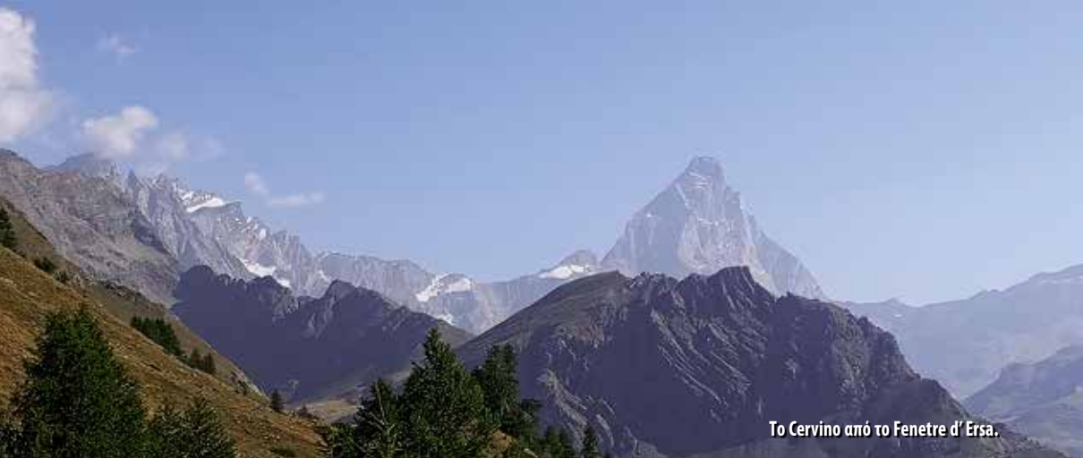
Το Cervino από το Fenetre d' Ersa.

τα 1850μ. και στη συνέχεια μέσα από δάσος και περνώντας από μια στήνη βγήκαμε σε 2 ώρες στο διάσελο Fenetre d' Ersa (2290μ.). Μετά από μια μικρή στάση κατεβήκαμε λίγο χαμηλότερα και στη συνέχεια τραβερσαριστά και με μια σύντομη αλλά απότομη ανηφόρα βγήκαμε στη λίμνη Tzan μετά από 1,5 ώρα, όπου κάναμε μια πιο μεγάλη στάση ευκαιρία για μπάνιο για τους τολμηρούς. Στη συνέχεια ανηφορίσαμε και σε 30' φτάσαμε στο διάσελο Fenetre du Tzan (2736μ.). Από εκεί ακολουθούσε μια μεγάλη κατάβαση μέχρι τα 2500μ. και στη συνέχεια μια μικρή ανάβαση μέχρι το bivacco Reboulaz (2580μ.). Πολύ ωραίος χώρος με 20 κρεβάτια και κουζίνα, αλλά δυστυχώς η βρύση απ' έξω είχε στερέψει. Σύντομα ξεκινήσαμε πάλι και μετά από 1 ώρα φτάσαμε στο διάσελο Col Terray (2775μ.), απ' όπου ξεκινά μια απότομη κατηφόρα και στη συνέχεια μια τραβέρσα σε εντυπωσιακή ορθοπλαγιά. Με μικρά ανεβοκατεβάσματα βγήκαμε στη κοιλάδα κάτω απ' το καταφύγιο και με μικρή ανάβαση μετά από 8,5