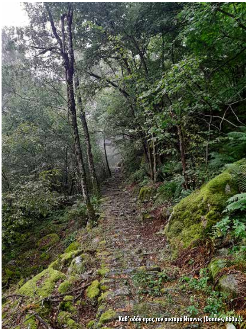
Καθ' οδόν προς τον οικισμό Ντοννές (Donnes, 860μ.).

Από εκεί, το μονοπάτι συνεχίζει με ανηφορική πορεία περίπου δύο ωρών, καταλήγοντας στο διάσελο Κολ Πουσεϊγ (Col Pousseil, 2.120 μ.), το τελευταίο διάσελο της Alta Via 2. Η κατάβαση ξεκινά μέσα από αλπικά λιβάδια και συνεχίζεται σε πυκνά δάση, μέχρι τον οικισμό Ντοννές (Donnes, 860μ.). Στη συνέχεια περνά από μικρούς οικισμούς, για να καταλήξει στην κεντρική κοιλάδα του ποταμού Ντόρα Μπάλτεα και στο χωριό Ντοννάς (Donnas, 330μ.), στα όρια της Κοιλάδας της Αόστα, όπου και ολοκληρώθηκε η διάσχισή μας. Ο ποταμός Ντόρα Μπάλτεα είναι ο κύριος υδατικός άξονας της Κοιλάδας της Αόστα: πηγάζει από τον παγετώνα του Μον Μπλαν (κοιλάδα Veny), διασχίζει ολόκληρη την κοιλάδα και εκβάλλει στον Πάδο. Το Ντοννάς, στην κάτω κοιλάδα, είναι γνωστό για το σωζόμενο τμήμα της