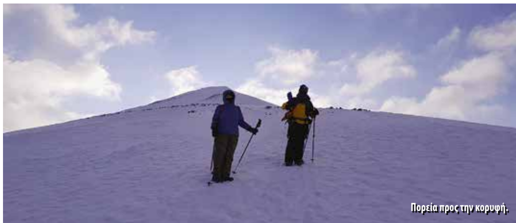
Πορεία προς την κορυφή.

για λόγους οικονομίας. Ψυγεία τουλάχιστον δεν χρειάζονται! Σε αυτόν τον αφιλόξενο τόπο που η επιβίωση διαχρονικά είναι άθλος, η γέννηση της ανθρώπινης ζωής και ο θάνατος απλά δεν υφίστανται!! Οι μέλλουσες μητέρες του Longyearbyen ταξιδεύουν υποχρεωτικά στην ενδοχώρα της Νορβηγίας (συνήθως στο Tromsø, πρωτεύουσα του βόρειου Αρκτικού Κύκλου). Ομοίως ο θάνατος δεν έχει θέση σε αυτά τα μέρη από την στιγμή που το ανθρώπινο σώμα δεν αποσυντίθεται στο παγωμένο έδαφος, οπότε η λύση της μεταφοράς της σορού στην ενδοχώρα είναι μονόδρομος.