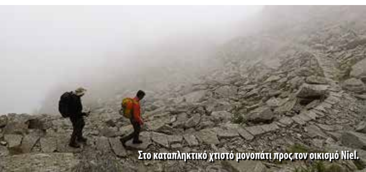
Στο καταπληκτικό χτιστό μονοπάτι προς τον οικισμό Niel.