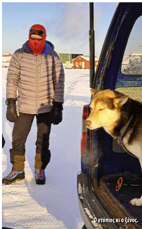
Ο ντόπιος κι ο ξένος.

Δίωρη πτήση με Norwegian για το Longyearbyen Svalbard, εδώ πρέπει να επισημάνουμε ότι τη συγκεκριμένη γραμμή εκτελούν αποκλειστικά οι δύο νορβηγικές εταιρείες, η SAS (Scandinavian) και η Norwegian. Τα αεροσκάφη είναι ειδικά εξο-