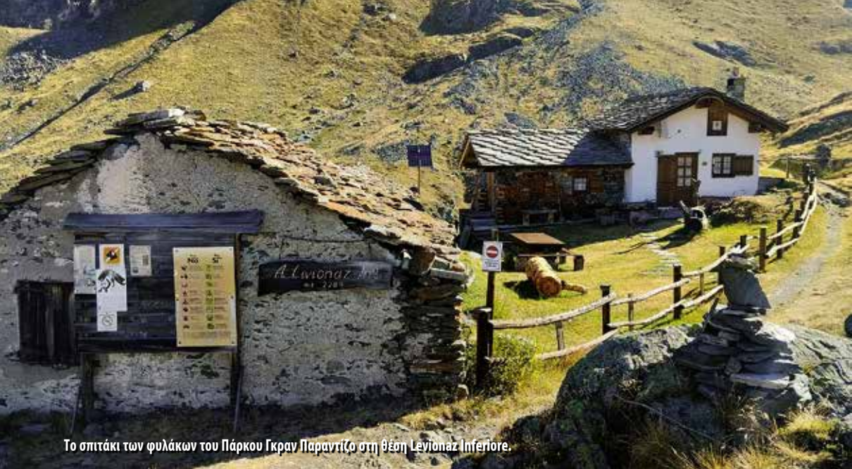
Το σπιτάκι των φυλάκων του Πάρκου Γκραν Παραντίζο στη θέση Levionaz Inferiore.

βουνοκορφών και στα αλπικά λιβάδια. Η πλήρης διάσχιση διαρκεί συνήθως 13 έως 17 ημέρες, με τη δυνατότητα ωστόσο για συντομεύσεις ανάλογα με τον διαθέσιμο χρόνο και τη φυσική κατάσταση.