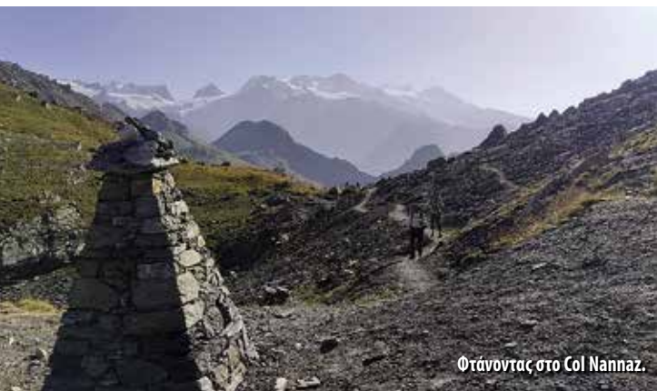
Φτάνοντας στο Col Nannaz.

9 Αυγούστου. Ξεκινήσαμε τη συνηθισμένη πρωινή ώρα μετά από ένα πολύ πλούσιο πρωινό και, από ένα σύντομο κομμάτι σε μονοπάτι, πήραμε το δρόμο μέχρι τον οικισμό Soussun, περάσαμε από το χιονοδρομικό και στη συνέχεια ανηφορικά από μονοπάτι μέχρι το καταφύγιο Ferraro (2070μ.) στον οικισμό Resy μετά από 1,5 ώρα. Στάση στα πανοραμικά παγκάκια και στη συνέχεια, από καγκελωτό μονοπάτι πάνω στη ράχη, κατεβήκαμε στο χωριό Saint Jacques des Allemands (1689μ.) μετά από 1 ώρα. Στάση για καφέ και ανεφοδιασμό και πιάσαμε την ανηφόρα με θέα πάλι προς το Monte Rosa. Μετά από 2,5 ώρες κοπιαστικής ανηφόρας φτάσαμε στο καταφύγιο Grand Tournalin (2535μ.).