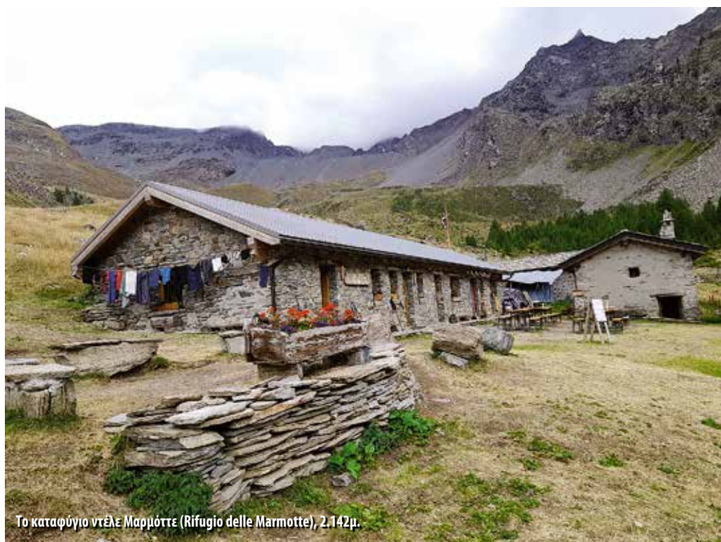
Το καταφύγιο ντέλε Μαρμόττε (Rifugio delle Marmotte), 2.142μ.

Το Εθνικό Πάρκο Γκραν Παραντίζο είναι το παλαιότερο εθνικό πάρκο της Ιταλίας (έτος ίδρυσης 1922) και ένα από τα σημαντικότερα οικοσυστήματα των Άλπεων. Εκτείνεται σε έκταση περίπου 700τ.χλμ. καλύπτοντας περιοχές τόσο της Κοιλάδας της Αόστα όσο και του Πιεμόντε. Το υψόμετρό του ξεκινά από τα 800μ. και φτάνει έως την κορυφή Γκραν Παραντίζο (4.061μ.), τη μοναδική κορυφή άνω των 4.000μ. που βρίσκεται εξ ολοκλήρου σε ιταλικό έδαφος. Σύμβολο του πάρκου είναι ο αίγαγρος (stambecco), ο οποίος έφτασε στα πρόθυρα της εξαφάνισης και διασώθηκε χάρη στη δημιουργία του προστατευόμενου αυτού χώρου. Εκτός από τους αίγαγρους, στο πάρκο ζουν