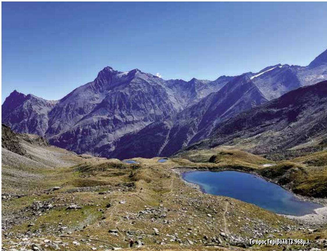
Το όρος Γκρίβολα (3.968μ.).

Από το καταφύγιο Σέλλα, η διαδρομή κατηφορίζει για περίπου 1ώ45' μέσα από αλπικά λιβάδια και ρεματιές, καταλήγοντας στον οικισμό Βαλνοντέ (Valnontey, 1.667μ.). Η Βαλνοντέ είναι μια πανέμορφη δευτερεύουσα κοιλάδα της κοιλάδας Κόνιε (Cogne), εντός του Εθνικού Πάρκου Γκραν Παραντίζο, με νότιο προσανατολισμό και μήκος περίπου 8χλμ. Είναι γνωστή για τα παγετωνικά της τοπία και τα μονοπάτια που οδηγούν σε καταφύγια όπως το Σέλλα. Οι φίλοι της χλωρίδας αξίζει να σταματήσουν εδώ για να επισκεφθούν τον Giardino Botanico Alpino «Paradisia», αλπικό βοτανικό κήπο που εκτείνεται σε περίπου 10.000