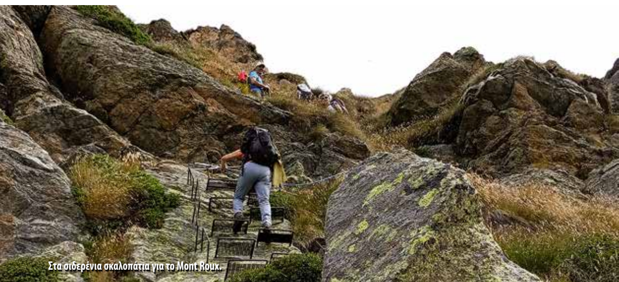
Στα σιδερένια σκαλοπάτια για το Mont Roux.

πε να κατεβούμε και να πιάσουμε τη διαδρομή πιο χαμηλά). Ακολουθώντας τον δρόμο για 10', πιάσαμε τη διαδρομή ψηλότερα. Από εκεί το μονοπάτι ανηφορίζει μέσα σε δάσος και ξέφωτα, περνά από μια στάνη και, σε γυμνό τοπίο πια, ανηφορίζει μέχρι το διάσελο Giassit (2024μ.), στα σύνορα με το Piemonte. Στη συνέχεια το μονοπάτι τραβερσάρει την πλαγιά μέχρι το απέναντι διάσελο (Colle Lace, 2120μ.), για να πιάσει στη συνέχεια την κόψη, που είναι ασφαλισμένη με σταθερά σχοινιά και σιδερένια σκαλοπάτια. Σύντομα, με μια μικρή τραβέρσα, βγήκαμε στην κορυφογραμμή κι εύκολα στην κορυφή Mont Roux (2318μ.) μετά από 3 ώρες. Ο καθαρός ορίζοντας και η άπλετη θέα μας επέβαλαν μια μεγάλη στάση πριν συνεχίσουμε στην κορυφογραμμή. Με μικρά κι ένα μεγάλο κατέβασμα στο διάσελο Carisey (2124μ.) φτάσαμε στο καταφύγιο Coda (2280μ.) μετά από 2 ώρες. Τακτοποιηθήκαμε σε δύο 4κλινα. Στο