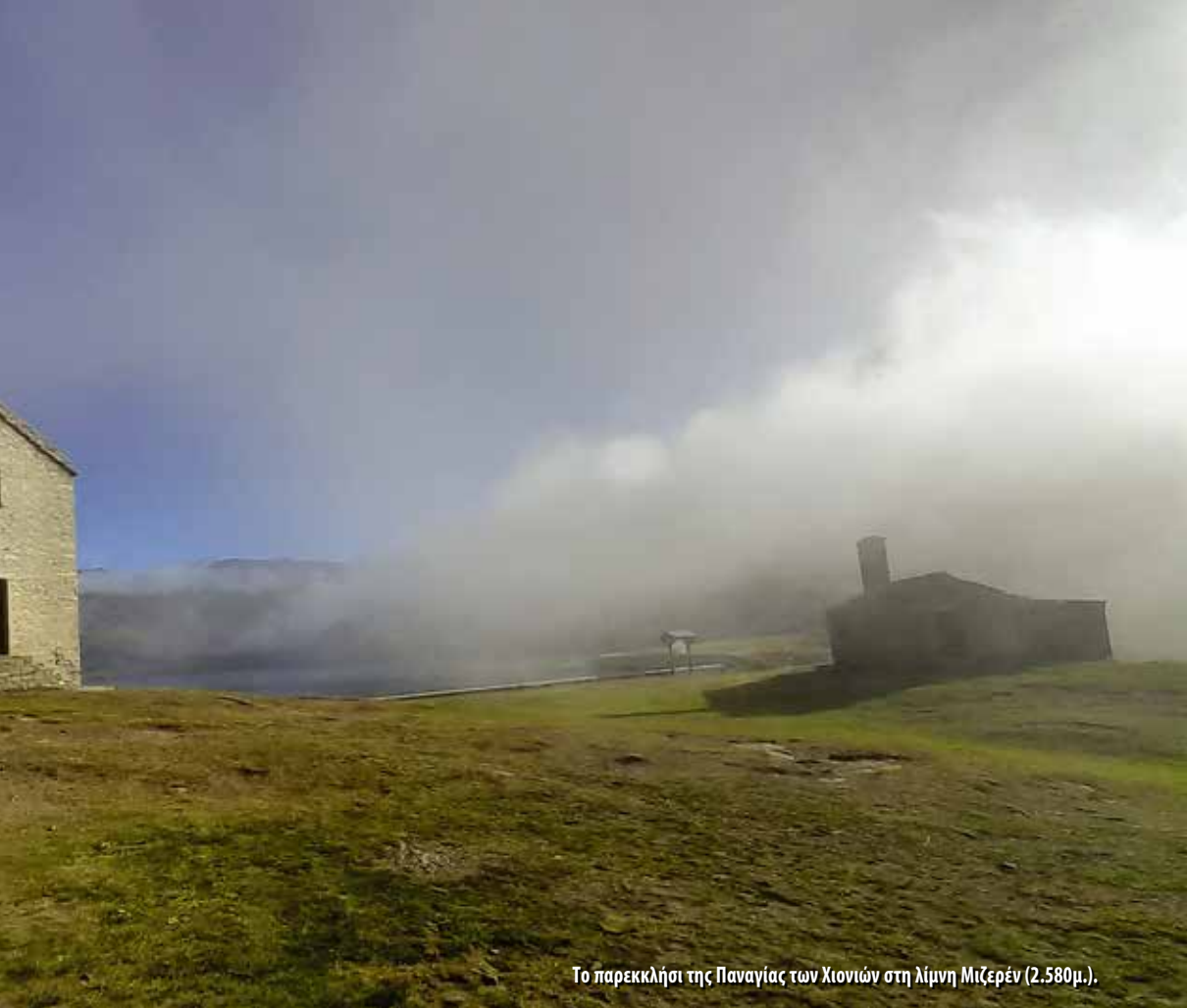
Το παρεκκλήσι της Παναγίας των Χιονιών στη λίμνη Μιζερέν (2.580μ.).

στή για το παρεκκλήσι της Παναγίας των Χιονιών (Madonna delle Nevi), που γιορτάζει στις 5 Αυγούστου. Η πρώτη κατασκευή ξεκίνησε ανάμεσα στο 1657 και 1659, ως τάμα των κατοίκων. Το σημερινό κτίσμα χρονολογείται από το 1881, έπειτα από ανακατασκευή του αρχικού ναού, όμως υπέστη ζημιές στον Β΄ Παγκόσμιο Πόλεμο και αποκαταστάθηκε το 1951, ενώ νέα συντήρηση πραγματοποιήθηκε το 2000. Σύμφωνα με την παράδοση, εικόνα ή άγαλμα της Παναγίας φέρεται να βρέθηκε από βοσκούς κοντά στη λίμνη κατά τον 16ο αιώνα, γεγονός που οδήγησε στην ανέγερση του πρώτου ναΐσκου. Κατά τα χρόνια της πανδημίας (1630-1636), οι κάτοικοι ορκίστηκαν ότι αν γλίτωναν από τον λοιμό, θα έχτιζαν ναό δίπλα στη λίμνη, όπως και συνέβη.