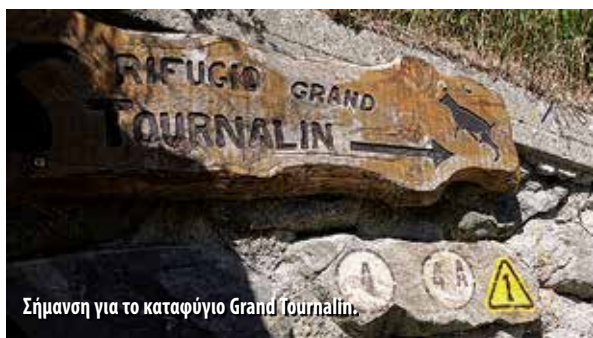
Σήμανση για το καταφύγιο Grand Journalin.

7 Αυγούστου. Ξεκινήσαμε ανηφορικά πάνω από τον ξενώνα, περάσαμε από τη λίμνη Grekij, φτάσαμε στη διασταύρωση προς το Colle Mologna Grande μετά από 2,5 ώρες μέσα σε ομιχλώδες τοπίο και από εκεί συνεχίσαμε τραβεραριστά προς το διάσελο Lazooney (2400μ.) μετά από 1 ώρα. Μια μεγάλη στάση στον ήλιο που είχε κάνει