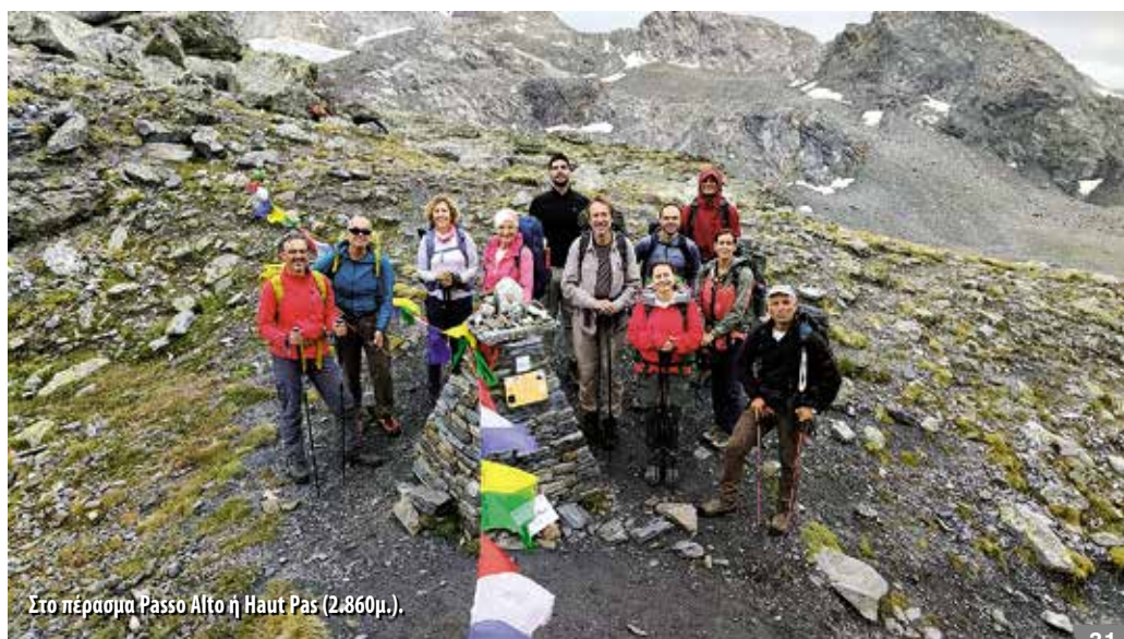
Στο πέρασμα Passo Alto ή Haut Pas (2.860μ.).

Από το καταφύγιο Ελιζαμπέττα Σολντίνι κατεβήκαμε περίπου 200μ. και στη συνέχεια ανηφορίσαμε προς το διάσελο Κολ ντε Σαβάν (Col des