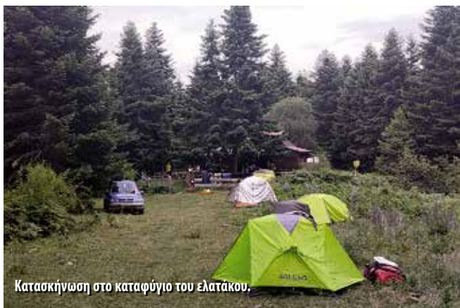
Κατασκήνωση στο καταφύγιο του ελατάκου.

Η Τρύπα της Όσκληνης είναι από εκείνα τα σημεία που δεν περιγράφονται εύκολα. Το στενό του Αγραφιώτη, το νερό, οι βουτιές, η χαλάρωση, το γέλιο — μια από τις ωραιότερες στιγμές της διάσχισης για την ομάδα. Το απόγευμα, απαιτητική πορεία μέσα από αγνά μονοπάτια και πεσμένα δέντρα μέχρι τα Επινιάνα, όπου χαρήκαμε τη φιλοξενία του Κώστα Γατζούδη. Ω.Π. 6, Υ.Δ.-400μ./+500μ.