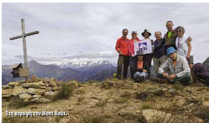
Στη κορυφή του Mont Roux.