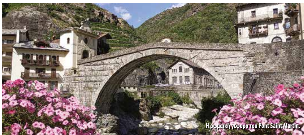
Η ρωμαϊκή γέφυρα του Pont Saint Martin.

πρωί κι από τη πλατεία ακολουθήσαμε το μονοπάτι Νο 3, που ανηφόριζε ανάμεσα σε σπίτια και αμπελώνες. Κόβοντας την άσφαλτο μερικές φορές κι ακολουθώντας την, στο τέλος φτάσαμε στο χω-