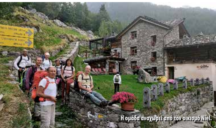
Η ομάδα αναχωρεί από τον οικισμό Niel.

σε διασταύρωση μονοπατιού προς το καταφύγιο Varma, που κόβει τη κυκλική διαδρομή μέσω του φράγματος Vargno. Την ακολουθήσαμε και, τραβερσαριστά στην πλαγιά, περάσαμε αρκετούς χειμάρρους που τροφοδοτούν τη λίμνη. Τον τελευταίο τον περάσαμε με γέφυρα κι από εκεί αρχίζει μια ανηφορική πορεία, για να βγούμε στη διαδρομή δίπλα σε δύο στάνες. Από εκεί μια έντονη ανηφόρα μας έβγαλε μετά από 5,5 ώρες στο πανέμορφο καταφύγιο στα 2062μ., πάνω από την ομώνυμη λίμνη και κάτω από τη κορυφή του Mont Mars. Μείναμε όλοι μαζί σ' ένα δωμάτιο και το βράδυ απολαύσαμε ένα πολύ γκουρμέ δείπνο.