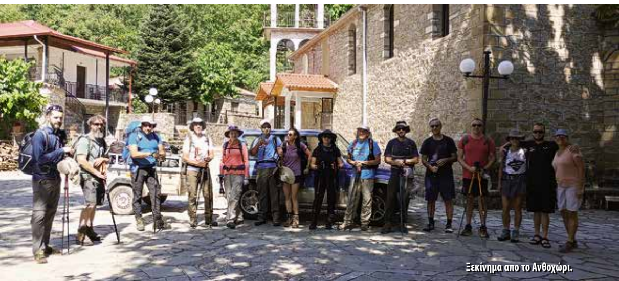
Ξεκίνημα απο το Ανθοχώρι.