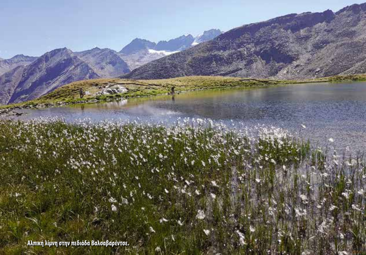
Αλπική λίμνη στην πεδιάδα Βαλσαβαρέντσε.

αγριοκάτσικα, μαρμότες, αλεπούδες, χρυσαετοί και γυπαετοί. Η χλωρίδα του είναι εξίσου πλούσια: δάση από λάρικα, ερυθρελάτη και πεύκο, καθώς και αμέτρητα είδη αλπικών λουλουδιών, όπως το εντελβίαις και οι γεντιανές. Ιδιαίτερο ενδιαφέρον παρουσιάζουν οι λάρικες, τα μοναδικά κωνοφόρα της Ευρώπης που ρίχνουν τα φύλλα τους το φθινόπωρο. Τότε οι βελόνες τους παίρνουν χρυσοκίτρινο χρώμα πριν πέσουν, αφήνοντας τα δέντρα γυμνά για τον χειμώνα.