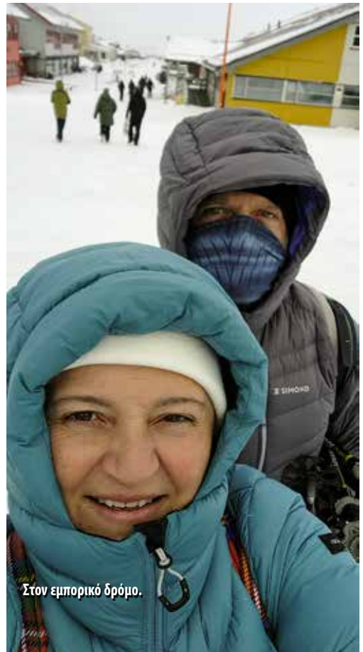
Στον εμπορικό δρόμο.