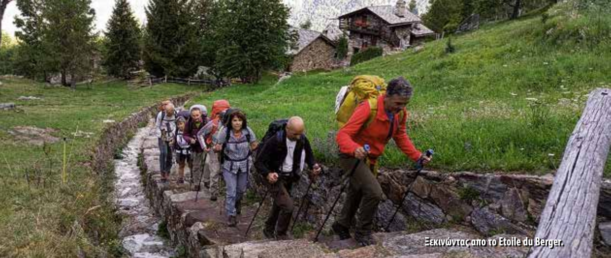
Ξεκινώντας από το Etoile du Berger.

ριουδάκι Perloz. Εκεί λόγω μιας κατολίσθησης είχε κλείσει το μονοπάτι προς τη γέφυρα του ποταμού Lys κι έπρεπε να κάνουμε έναν γύρο. Έτσι διασχίσαμε το χωριό και, ακολουθώντας την ασφάλτο προς τον οικισμό Nantay, συνεχίσαμε κατηφορικά, περάσαμε την οδική γέφυρα για να ανηφορίσουμε προς τον οικισμό Remondin, όπου πιάσαμε πάλι τη διαδρομή. Από εκεί ανηφορίσαμε ομαλά μέχρι τον οικισμό Τουχ, απ' όπου άρχισε μια ανηφόρα σε σκαλιά με μεγάλη κλίση μέχρι που φτάσαμε στο εκκλησάκι της Santa Margherita. Στη συνέχεια, με μια πιο ομαλή κλίση, φτάσαμε στο κατάλυμά μας (Etoile du Berger, 1430μ.) μετά από 5,5 ώρες. Μοιραστήκαμε σε πολύ ωραία δωμάτια σ' ένα απίθανο αλπικό περιβάλλον, που ολοκληρώθηκε μ' ένα εξαιρετικό δείπνο με τοπικές λιχουδιές.