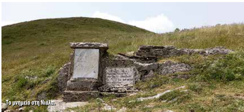
Το μνημείο στη Νιάλα.